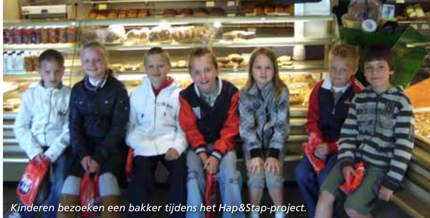
Kinderen bezoeken een bakker tijdens het Hap&Stap-project.