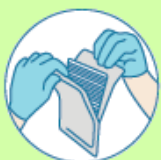
Gaasjes om wondranden te drogen