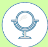
Eventueel een spiegel om de wond te kunnen inspecteren