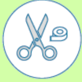
Schaar, schoongemaakt met alcohol