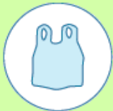
Plastic zakje om het afval in te doen