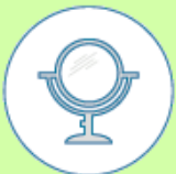
Eventueel een spiegel om de wond te kunnen inspecteren